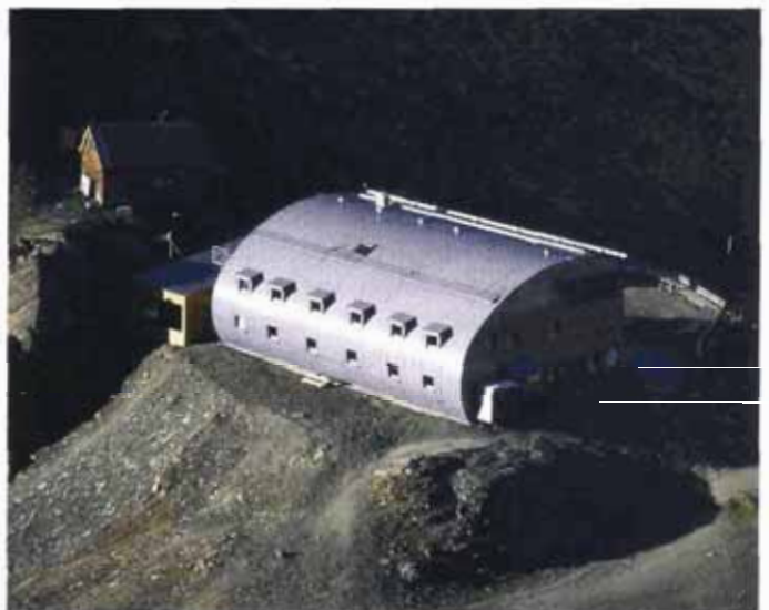
Die Stüdlhütte heute, © DAV-Sektion Oberland

© Archiv des Deutschen Alpenvereins, München