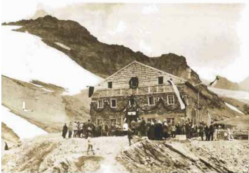
Erweiterte Stüdl-Hütte der DAV-Sektion Prag, 1928

Das allgemeine Interesse an den vorhandenen Unterlagen ist seit der Eröffnung des Alpenverein-Museum groß. Museen, Ausstellungen, Gemeinden und Tourismusregionen fragen um Leihgaben an. Aktuell fanden sich Materialien aus dem Archiv des OeAV bei der Tiroler Landesausstellung 05 sowohl im „Hotel“ in Hall als auch in der „Mauer“ in Galtür, bei der Niederösterreichischen Landesausstellung „Lauter Helden“, im „Alpinarium“ Hinterstoder der Ausstellung „E. T. Compton“ und bei der Ausstellung „Montagna. Arte scienza, mito da Dürer a Warhol“ in Rovereto im Jahr 2004. ■